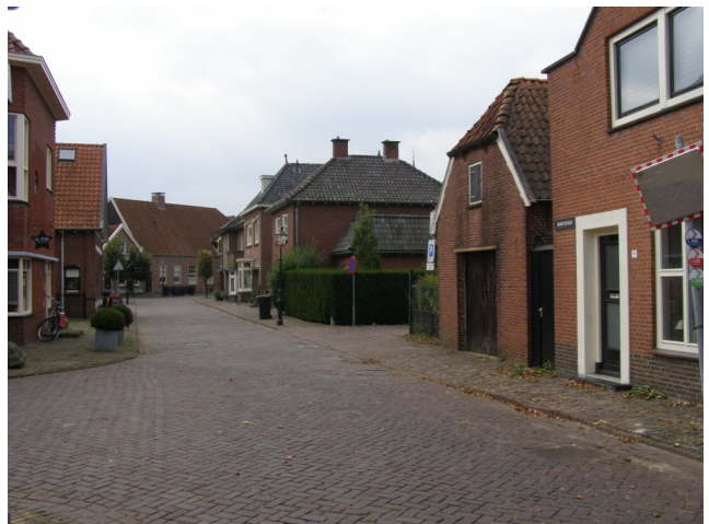
De paardenstal van Schoemaker en de huizen op de gedempte haven.

meestal turf. Of haalden ze hun vrachtje op, vaak textiel, maar ook wel landbouwproducten. Nu moesten ze met hun bootjes weer terug naar de Bornse Aa. Maar dat was een probleem, want de Bornse Beek was hier zo smal dat ze niet konden draaien. Ze voeren daarom achteruit naar het noorden tot ze, bij de aansluiting van de Bornse Beek op de Bornse Aa, konden keren in de bredere kolk, de Zielkolk; een verbreding van de beek voor de ziel of schut iets verder op 4) .