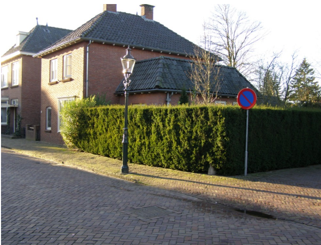
Woningen op de plaats waar vroeger de westelijke uitloper van de haven lag.

In de haven losten de schippers hun vrachtje,