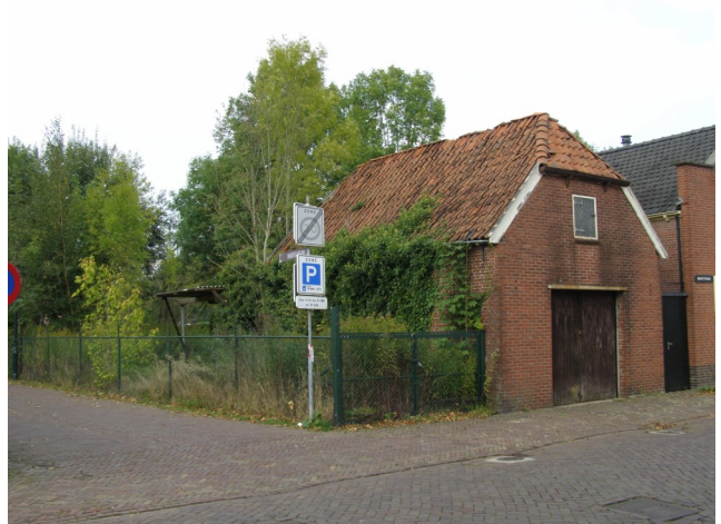
De oude paardenstal en koetshuis van dokter Schoemaker